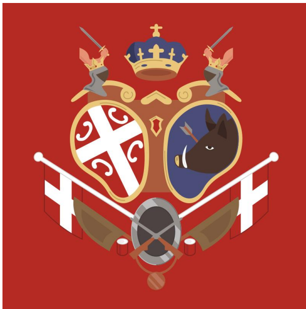
Српска застава из Првог српског устанка

Под појмом Српска револуција подразумевамо Први и Други српски устанак, јер се тим догађајима Срби нису само ослободили османске власти, већ су на простору Србије укинути турски феудални односи и почео је процес развоја буржоазије и грађанског друштва.